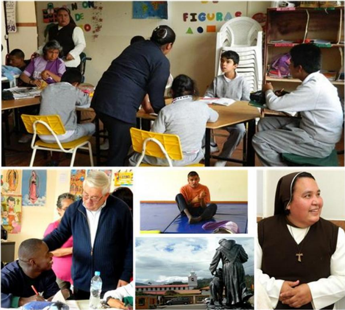
Casa de la Caridad, Penipe