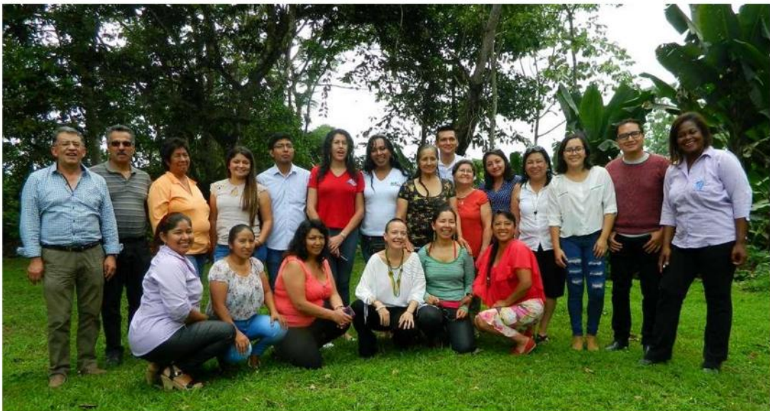
Santo Domingo, 4 y 5 de diciembre de 2018